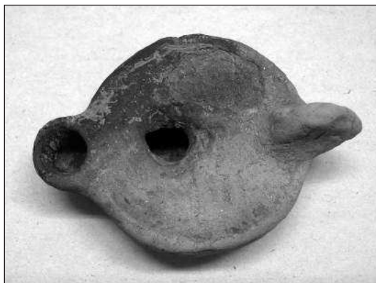
Слика 5 – Жижак из III века