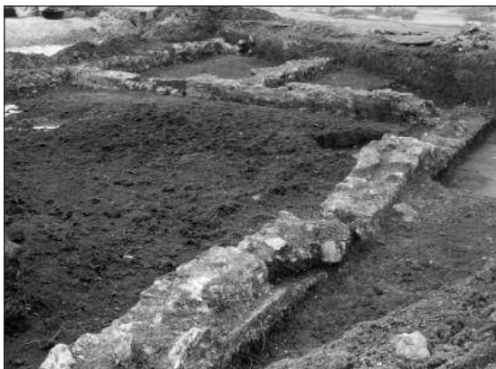
Слика 4 – Вила субурбана, поглед са југа