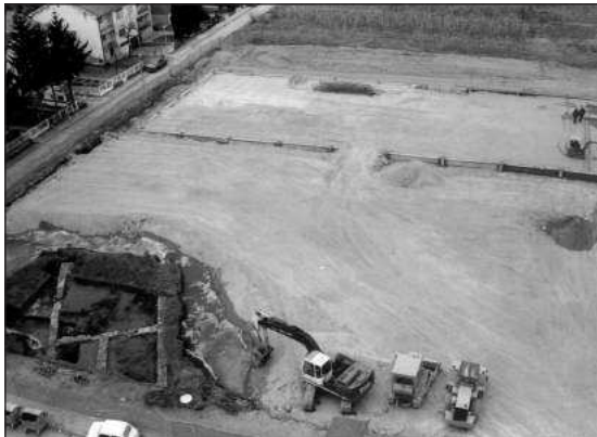
Figure 2 – Staro Vašarište, Pirot, end of archaeological excavations

Током зиме 2005–2006. године, у источној четвртини Старог вашаришта започета је изградња Макси дисканта, и то без дозволе надлежне установе за заштиту. Да ствар буде још гора, на целом простору вршена је замена тла због мочварног земљишта, тако да је „извађено“ више од пола локалитета пре него што су напорима надлежног Завода за заштиту споменика културе из Ниша и Музеја Понишавља добијена средства за