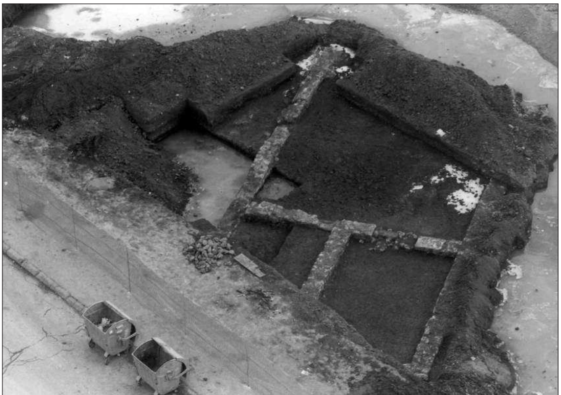
Figure 3 – Staro Vašarište, Pirot, villa suburbana