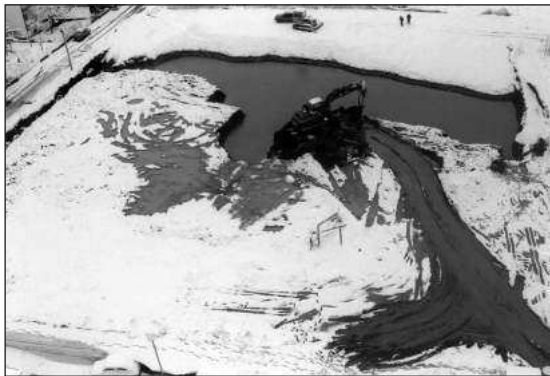
Figure 1 – Staro Vašarište, Pirot, during earthwork – soil switch

Слика 2 – Старо вашариште у Пироту, завршетак археолошких радова